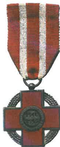
Herinneringskruis 1940-1945 van het Nederlandse Roode Kruis