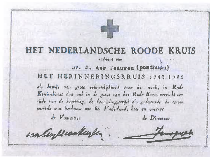
Dat het Herinneringskruis ook postuum kon worden toegekend bewijst deze oorkonde.

Het Herinneringskruis, eventueel met gesp of losse gesp, werd met een begeleidende brief opgestuurd.