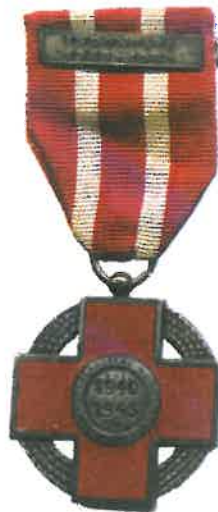
Herinneringskruis van het Nederlandse Rode Kruis met gesp "Indonesië 1945-1950"

Het Herinneringskruis met de gesp "Indonesië 1945-1950" was verpakt in een bruin papieren zakje, afmeting ca. 10,7 x 6,6 centimeter, met de tekst: "s RIJKS MUNT / UTRECHT".