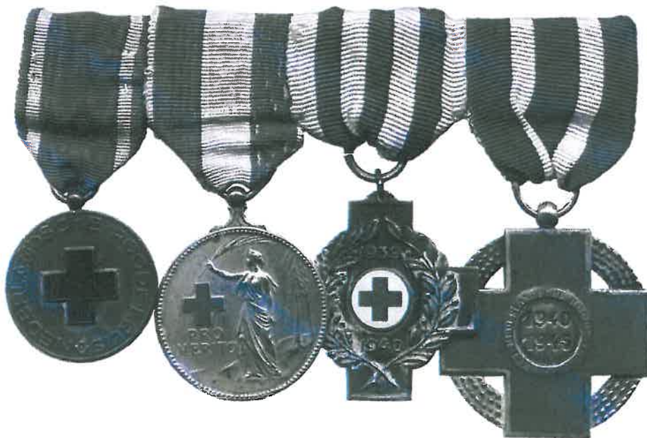
Medaillegroep van een onbekende Rode Kruis-vrijwilliger, met uiterst rechts het Herinneringskruis 1940-1945.

By showing all the documents the author shares more details with the reader than normally is known by the collectors.