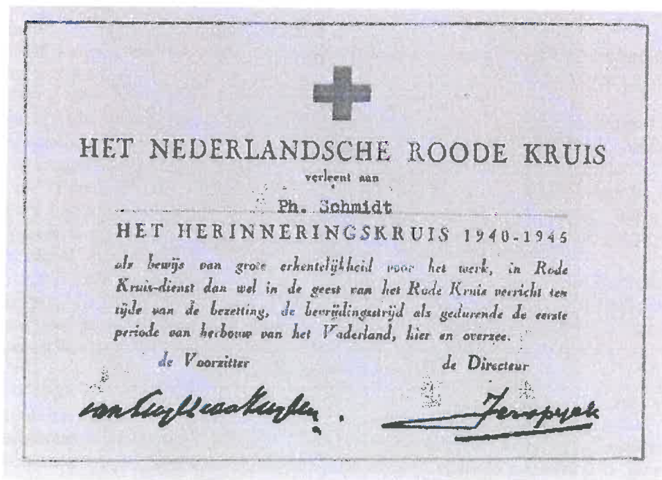
Oorkonde Herinneringskruis 1940-1945 van het Nederlandse Rode Kruis

Bij het Herinneringskruis werd een oorkonde verstrekt, getekend door de voorzitter en de directeur. Deze oorkonde heeft de afmeting van circa 15 x 10 centimeter.