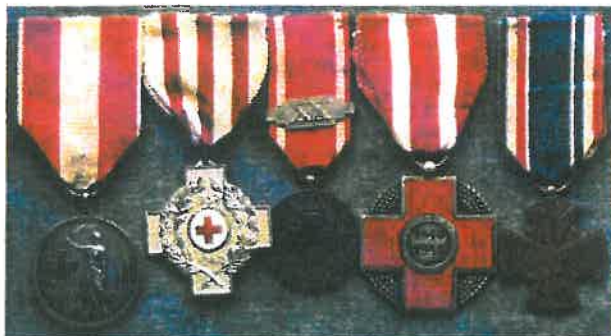
Groep van een Rode Kruis-medewerker: v.l.n.r.: Medaille van Verdienste in zilver, Herinneringskruis 1939-1940 in zilver, Medaille voor trouwe dienst met jaarteken 'XX', Herinneringskruis 1940-1945, Mobilisatiekruis 1914-1918.