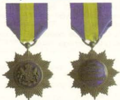
Zilveren Ster van Trouw en Verdienste

Uit: UTRECHTS NIEUWSBLAD vrijdag 21 juni 1929