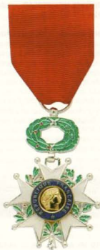
Frankrijk, Chevalier de la Legion d'Honneur

Hij was Ridder in de Leopoldsorde van België. De eerste en oudste Belgische orde ingesteld in 1832 door koning Le-