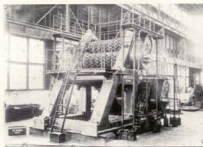
Molenmachine, Hanid en Leng Dusseldort, Molen 30 x 60, inlaatzijde, van de suikertabrick Tjebongan.