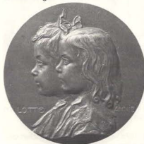
Eenzijdige bronzen penning, diameter 120 mm